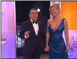
Jorge Javier Vázquez y Belén Esteban